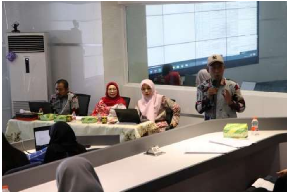
Gambar 1. Pelaksanaan Uji Konsekuensi