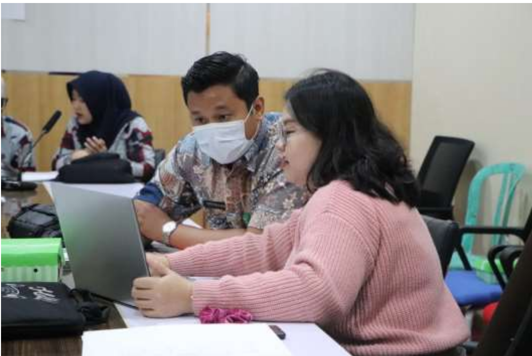
Gambar 4. Pelaksanaan Asistensi dan Verifikasi Daftar Informasi Publik