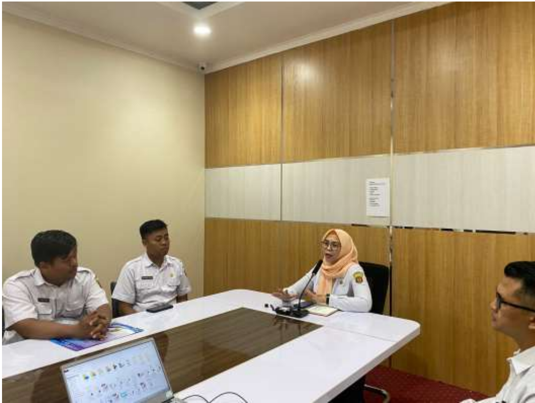
Gambar 5. Pelaksanaan Asistensi dan Verifikasi Daftar Informasi Publik