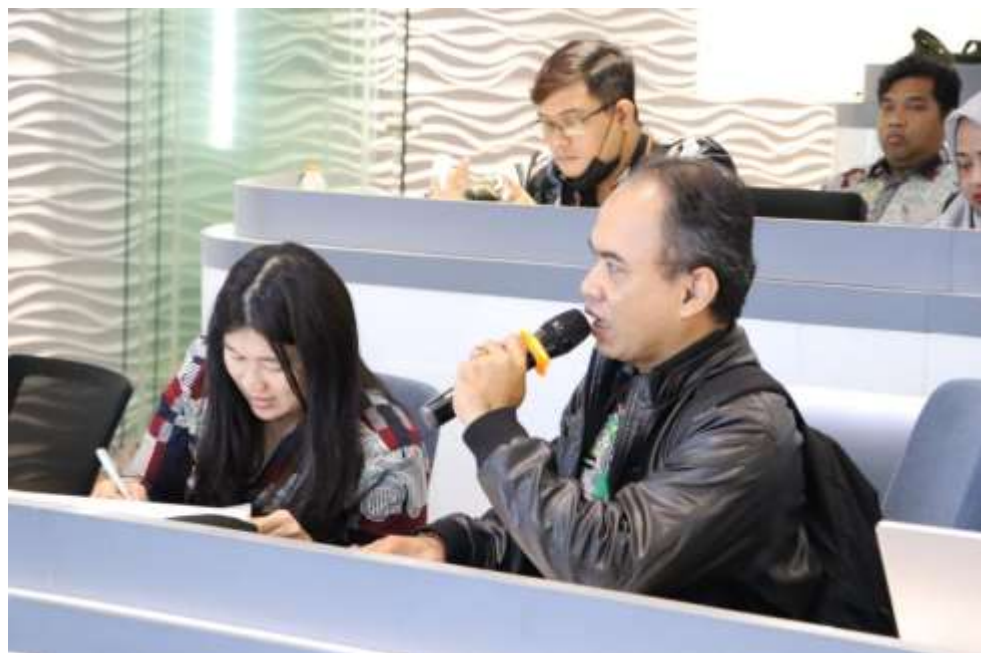
Gambar 2. Pelaksanaan Uji Konsekuensi