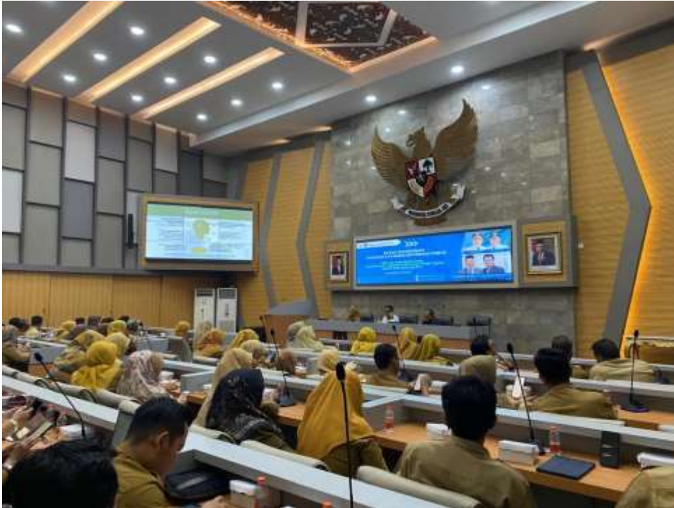
Gambar 7. Pelaksanaan Kegiatan Rapat Koordinasi Evaluasi Pelayanan Informasi Publik