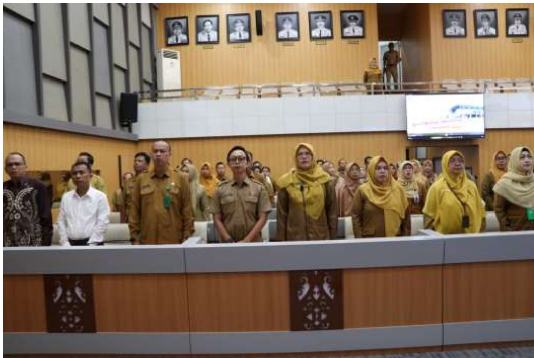
Gambar 8. Pelaksanaan Kegiatan Rapat Koordinasi Evaluasi Pelayanan Informasi Publik