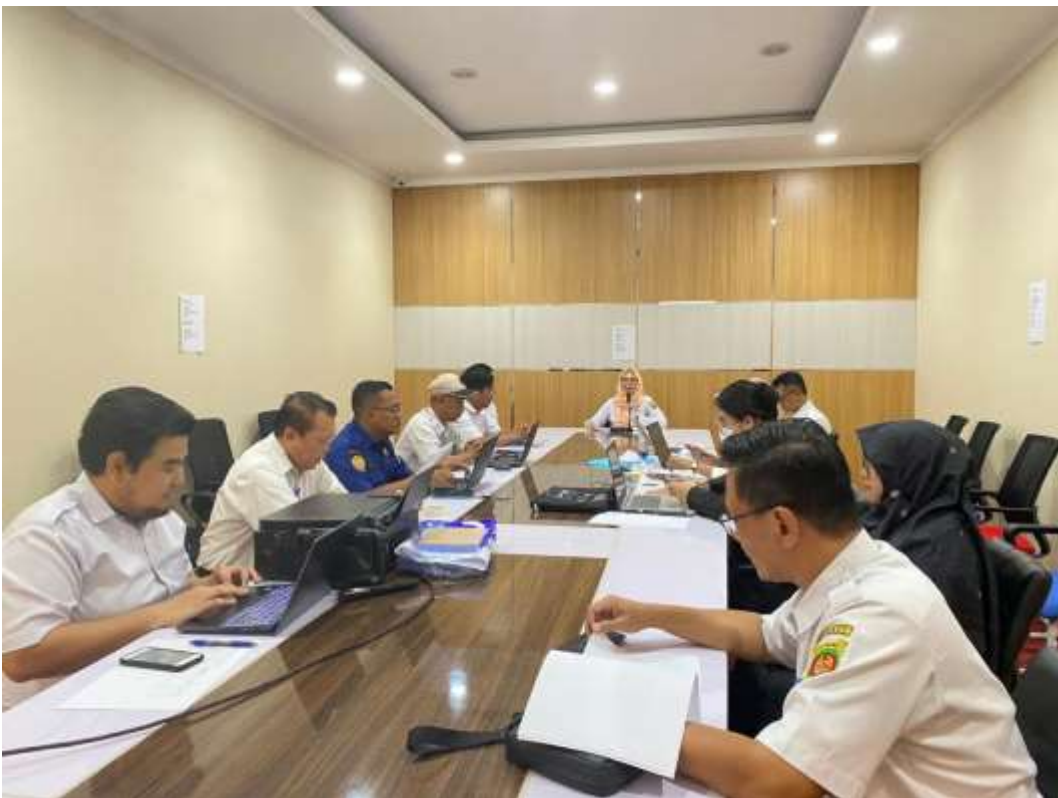
Gambar 6. Pelaksanaan Asistensi dan Verifikasi Daftar Informasi Publik