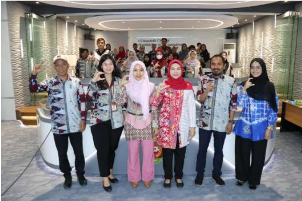
Gambar 3. Pelaksanaan Uji Konsekuensi