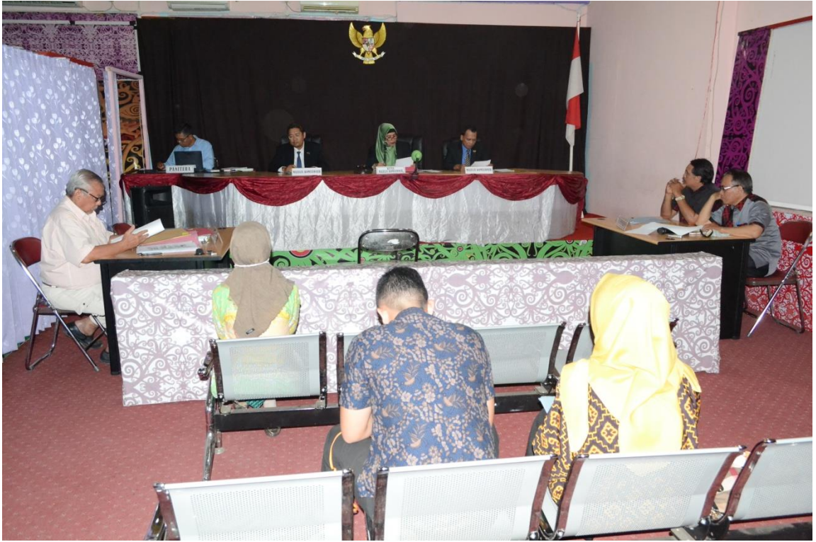
0003/REG-PSI/Agus Sindoro VS Pemkot Samarinda