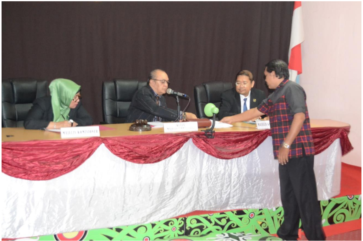
0002/REG-PSI/Agus Sindoro VS Kec. Palaran