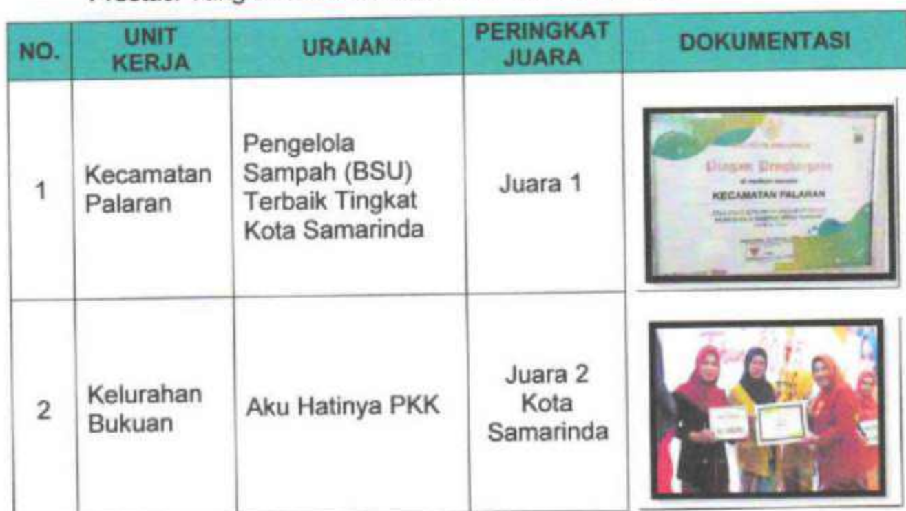
Prestasi Yang Diraih Kecamatan Palaran Tahun 2025