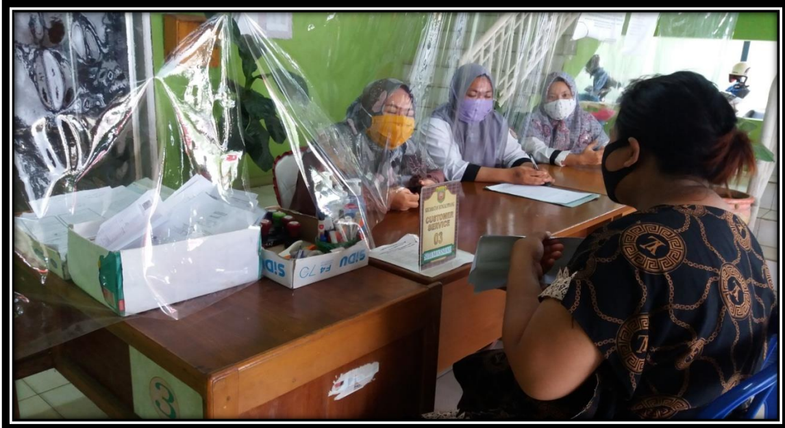
FOTO DOKUMENTASI KEGIATAN PELAYANAN OUT DOOR SELAMA PANDEMI COVID 19